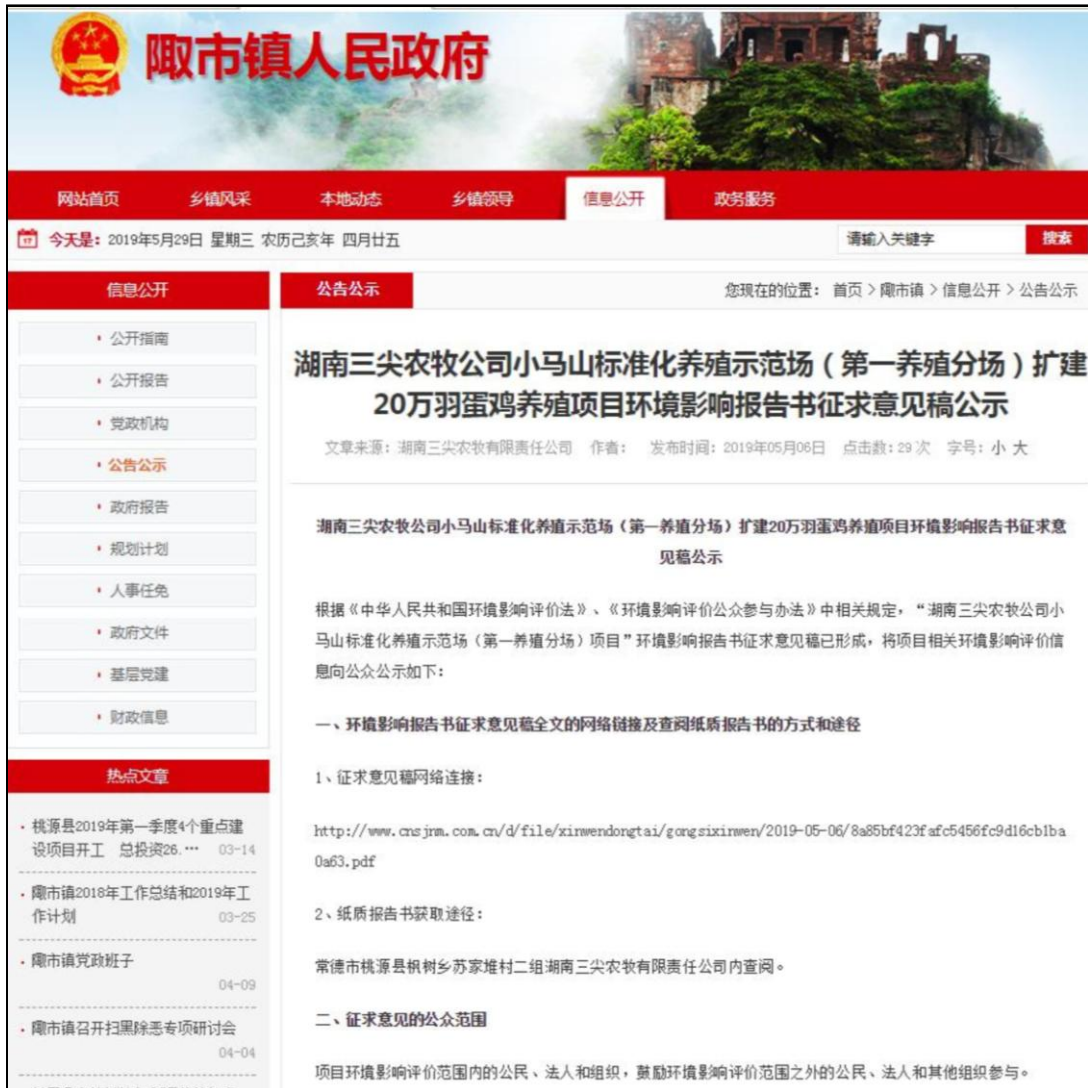
图 3-1 项目征求意见稿公示信息网上公示截图

湖南三尖农牧有限责任公司于 2019 年 5 月 6 日~2019 年 5 月 17 日在澧市镇人民政府网站（ https://www.taoyuan.gov.cn/Item/135684.aspx ）上将征求意见稿公开信息进行了公示，符合《环境影响评价公众参与办法》在建设项目所在地相关政府网站平台公示的规定，公示截图见图 3-1。