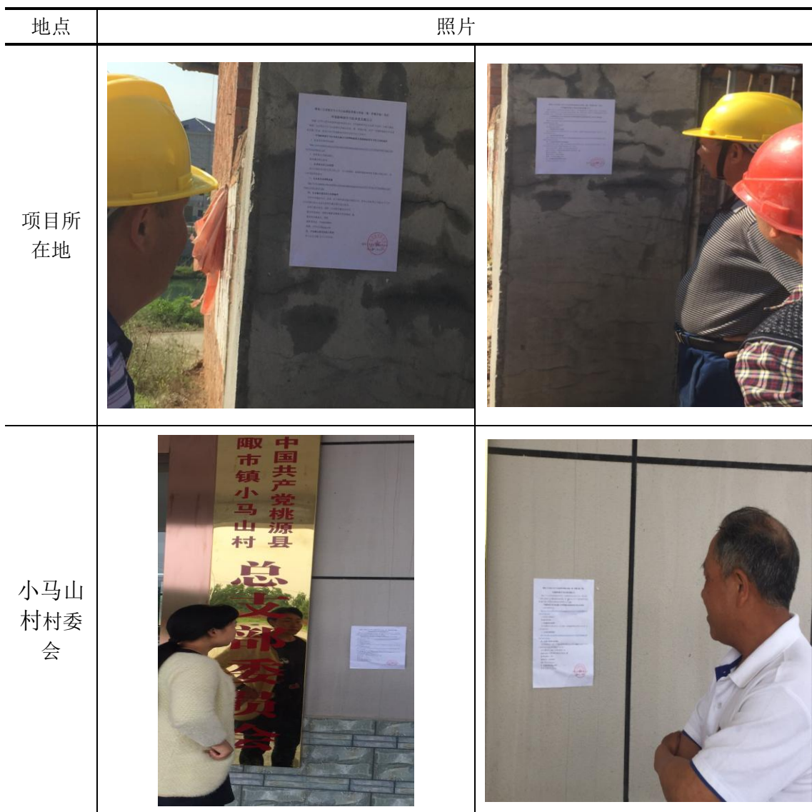
表 3-2 公告张贴现场照片