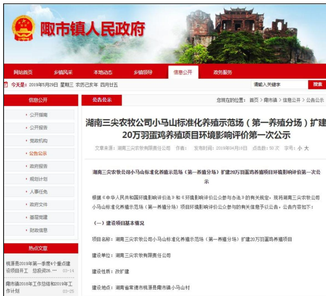
图 2-1 项目第一次公示截图

湖南三尖农牧有限责任公司于2019年4月18日在澧市镇人民政府网站进行了首次环境影响评价信息公开（ https://www.taoyuan.gov.cn/Item/135685.aspx ），符合《环境影响评价公众参与办法》在建设项目所在地相关政府网站公示的规定，公示截图见图2-1。