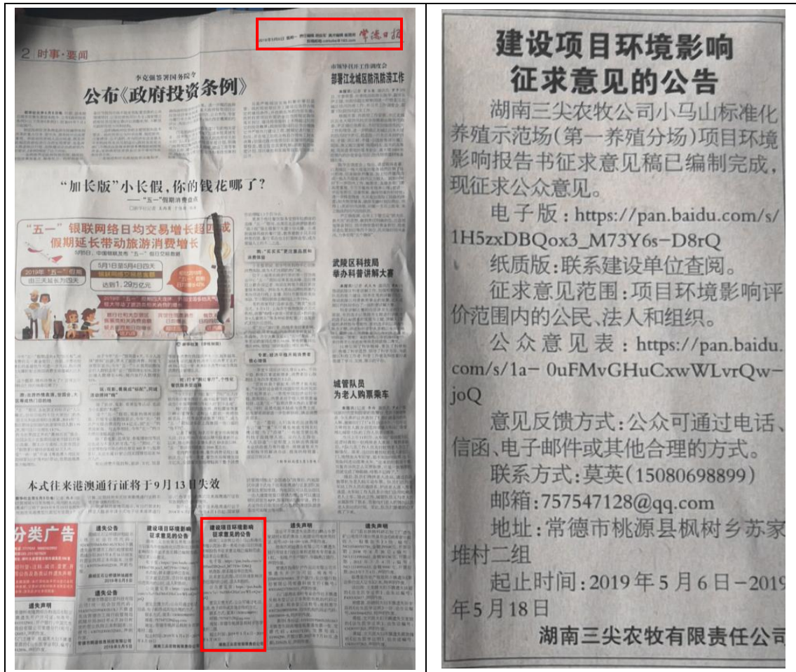
图 3-2 项目征求意见稿公示信息报纸公示照片（2019 年 5 月 6 日）